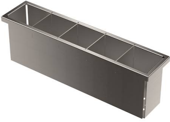
Cuvette perforée en acier inoxydable